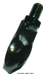
PUNTA PER NEA